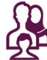
ثبت نام اولیا