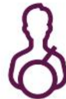
ثبت نام راننده