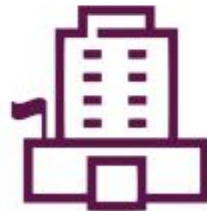
ثبت نام مدرسه