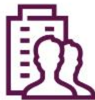
ثبت نام شرکت ها